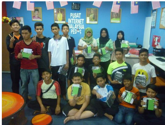
GAMBAR 3 :Bergambar Kenangan Ketika Mengikuti Program Latihan 1Malaysia.