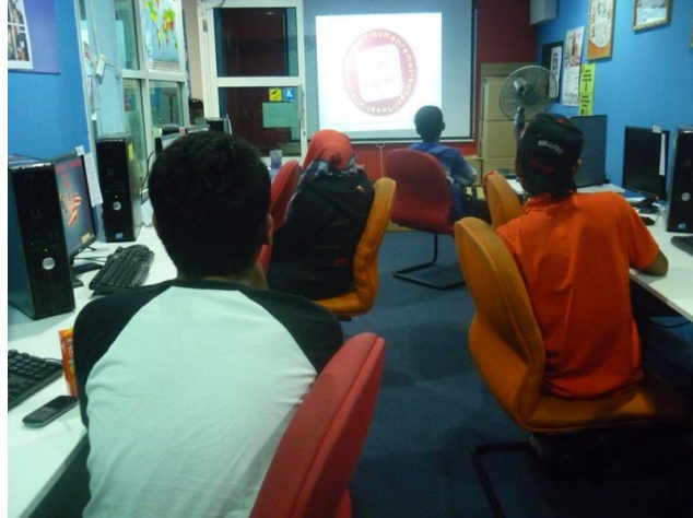
GAMBAR 2 : Ketika Mengikuti Program Kempen Pengguna Bijak Dan Usahawan.